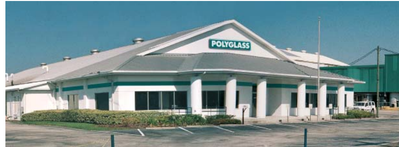
Winter Haven, Florida