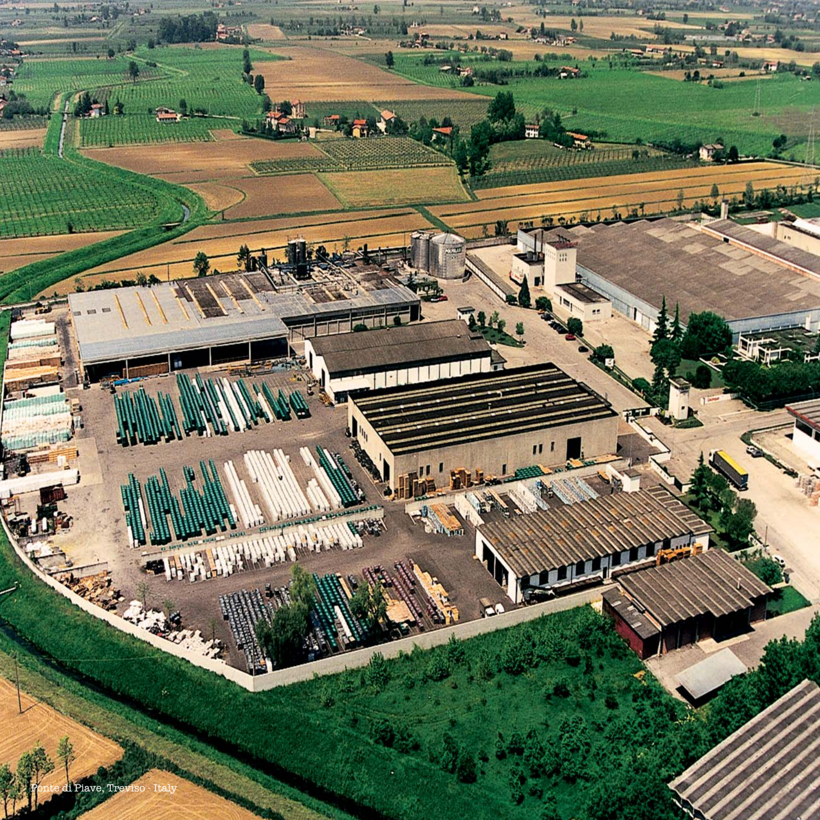
Fonte di Piave, Treviso - Italy